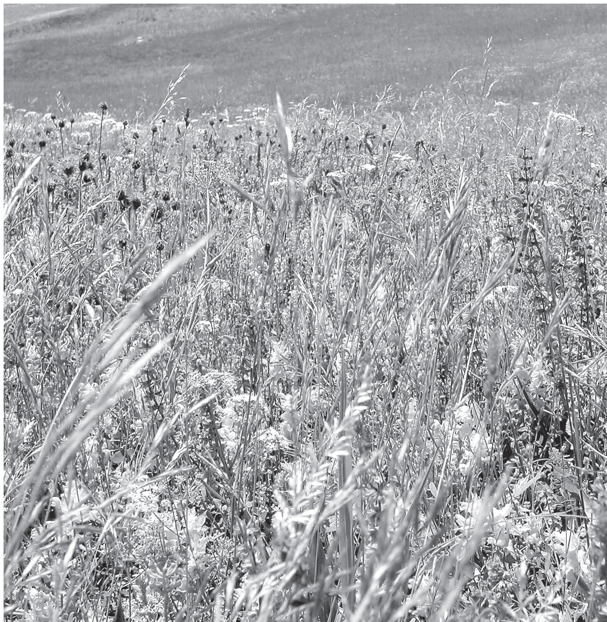
Auch auf dieser Wiese gibt's Essbares: Die gut versteckte und unscheinbare Sauerampfer.

Ausschliesslich dem Thema «Essbare Wildpflanzen» widmet sich hingegen das gleichnamige Buch aus dem AT Verlag. Dabei sind so viele Vertreter der Flora beschrieben, dass man sich fragt, welche Pflanzen man eigentlich nicht essen soll. Doch auch solche gibt es durchaus. Die Blätter der Maiglöckchen und Herbstzeitlosen beispielsweise, die jeden Frühling wieder ein Thema werden, wenn die ersten Bärlauchblätter spriessen, sollten auf keinen Fall verwechselt werden. Denn auch wenn die Herbstzeitlose im Herbst noch so schön blüht, ist sie tödlich giftig. Essen kann man dafür den weissen Gänsefuss. Der wächst an nährstoffreichen, trockenen Standorten. Das