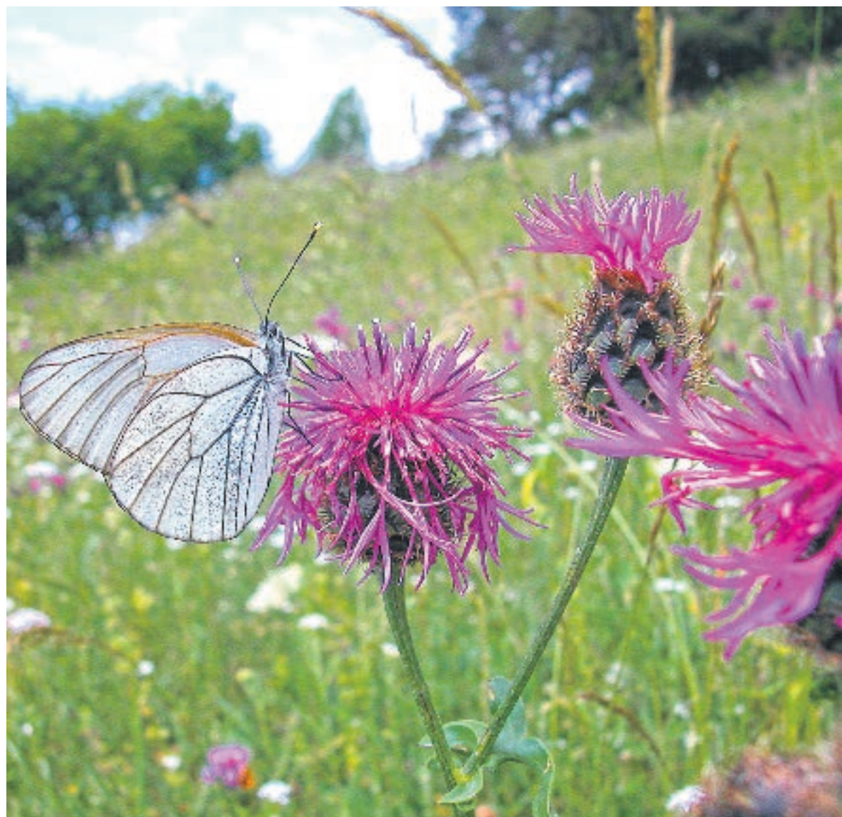
Ob der Schmetterling auch über die heilende Kraft der Pflanzen Bescheid weiss?

Doch um die heilenden Kräfte der Wiesen zu spüren und zu erleben, braucht man nicht immer den Umweg übers Heu. Die Sommerwiesen können da mit allerhand Heilsamem aufwarten. Schlüsselblume, Johanniskraut, Arnika, Frauenmantel oder Wildrose lassen grüssen.