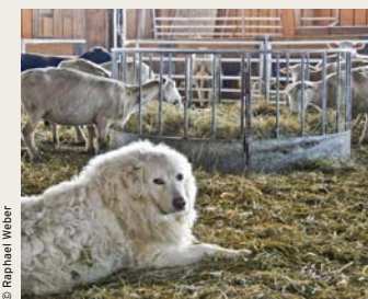
Herdenschutzhunde als Sicherheit