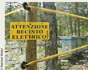
Bienenhäuschen mit Elektrozaun

Bären nehmen sich, was sie zum Leben brauchen. Für Imker und Landwirte kann das zum Problem werden. Doch die Probleme sind lösbar. Bienenhäuschen werden mit einem Elektrozaun vor naschenden Bären sicher. Herdenschutzhunde vertreiben den Bären von Schaf- und Ziegenherden. Fällt dem Bären einmal ein Nutztier zum Opfer, wird es durch Bund und Kanton voll entschädigt. Damit Bären ihr Futter nicht im Siedlungsgebiet suchen, wird der Abfall in bärensicheren Tonnen entsorgt.